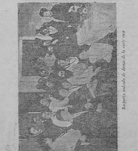
Rasputin rodeado de damas de la corte rusa

Grigori Efimovitch acostumbraba seguidamente a sentarse con toda comodidad en el sillón que le dejaban libre, escogía alguno de los minajeres que se le ofrecían y, al mismo tiempo, hablaba melancólicamente de Dios y de la santidad. Tenía también costumbre de abandonar súbitamente los temas edificantes para extenderse con toda profusión en cuestiones completamente distintas y para contar anécdotas escandalosas que le comunicaba el príncipe Andronnikov. Al mismo tiempo que masticaba a conciencia, barajaba, pues, las comedillas de la alta sociedad de Petersburgo, hablando, por ejemplo, de las relaciones del viejo Protopopov, ya medio chocado, con su enfermera o revelando las últimas noticias del Czar general y los secretos de la alta política de Tsarskoie-Selo. A veces, por la puerta entreabierta, asomaba la faz de un muchacho que reía estupidamente y miraba con curiosidad al comedor. Si alguna novicia se asomaba y preguntaba quien era aquella