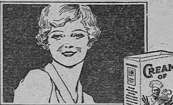
La Crema de Trigo cocida simplemente en agua es un alimento ideal para todas las edades porque contiene solamente las partes más nutritivas del trigo.

La excelente calidad de la Crema de Trigo es siempre igual. Es muy fácil de preparar y es, además, económica. Hay pocos alimentos tan completos como la Crema de Trigo. Pregúntele a su doctor.